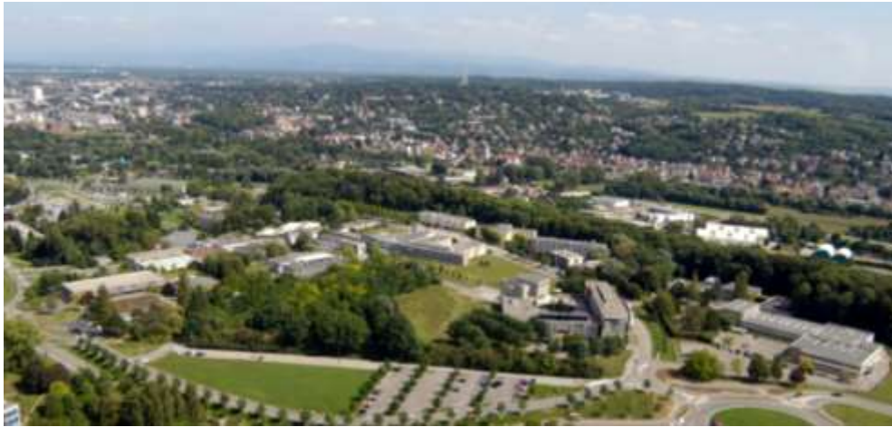
Illberg (FST, FLSH, ENSISA, ENSCMu)