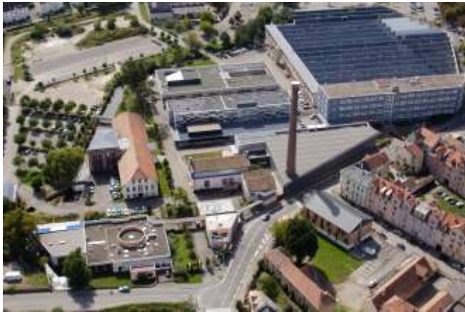
Grillenbreit (IUT – FMA marketing)