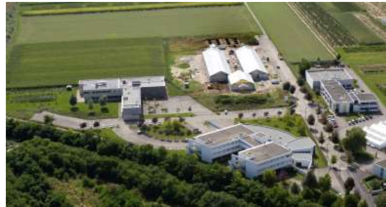
Biopôle (IUT – FMA agronomie)