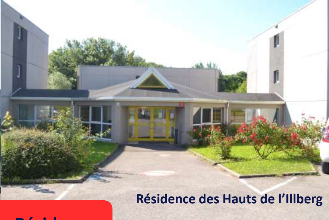
Résidence des Hauts de l'Illberg